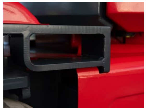
Ingebouwde gaten voor laadvorken